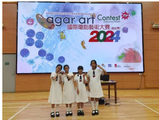
國際瓊脂藝術大賽2024(冠軍)