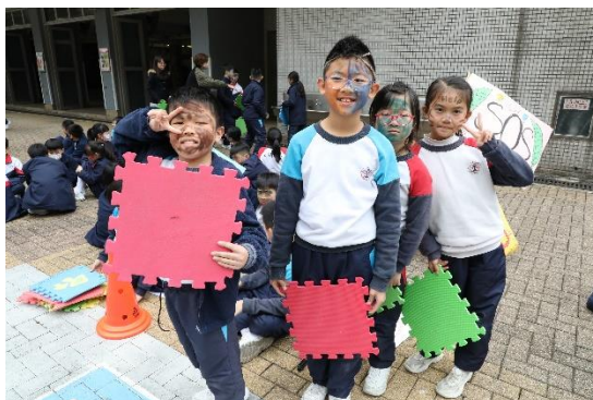
全方位學習 - 樂學至FUN FUN