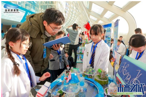
未來之城®全國賽小學組 (二等獎及最佳項目管理獎)

為了豐富學生的學習活動，促進學生的身心健康，學校開展達六十多個興趣小組，包含舞龍、唱團、手鐘手鈴、水墨畫、天才小廚神、中國舞、揚琴、二胡、古箏、中樂合奏、中國鼓、綜合藝術、Puppet Theatre、Living English Adventure、簡易田徑、趣味奧數培訓課程、奧林匹克數學培訓課程、羽毛球、乒乓球校隊、花式跳繩校隊、籃球校隊、古典詩詞書畫班、普通話說故事、中國鼓高班、二胡、琵琶/阮/柳琴、武術、公民兵團、資優解難培訓課程、英語大使資優班、Lego Robot、Coding Buddie、Happy Coding 等，學生積極參與，發揮個人潛能，並透過參與比賽，發揮學生在學術、藝術和體育等方面的優異潛能。