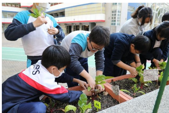
校園小園丁：農作物收成了

透過全面而有系統的「關愛校園」計劃，我們深信能發掘學生潛能，培養學生愛惜自己、關心別人，並把關愛精神延展至社區、祖國以至全世界。學校注重培養學生良好品德，建立正確的價值觀，除推行「環保」教育，提倡愛護環境外，還透過各項「健康校園」計劃，鼓勵學生養成良好的健康生活習慣，追求健康的人生。