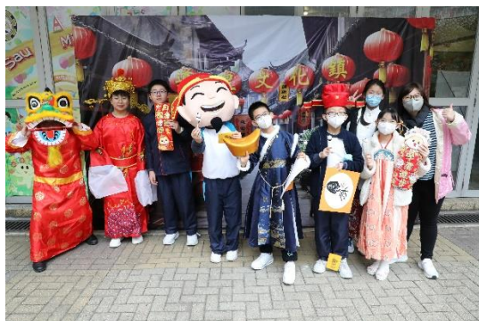
全方位學習 - 我愛中華文化

本校課程以學生為本，積極為學生提供多元學習經歷，包括全方位學習、資優培訓、自主閱讀等，讓每個學生透過體驗、探索，打下穩健的學術基礎。