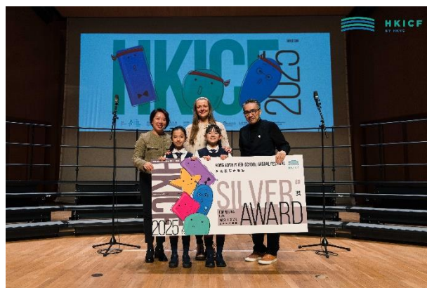
聯校音樂大賽2025高級組合唱團 (銀獎)