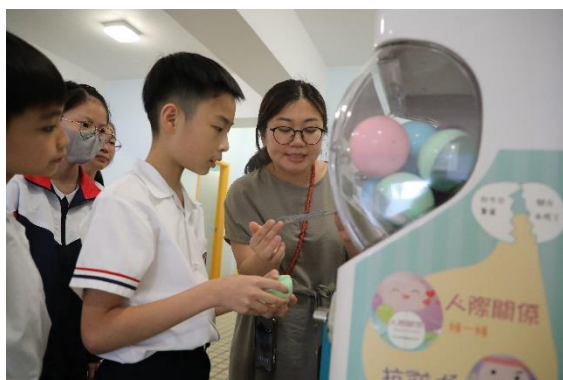
精神健康周-減壓扭扭蛋