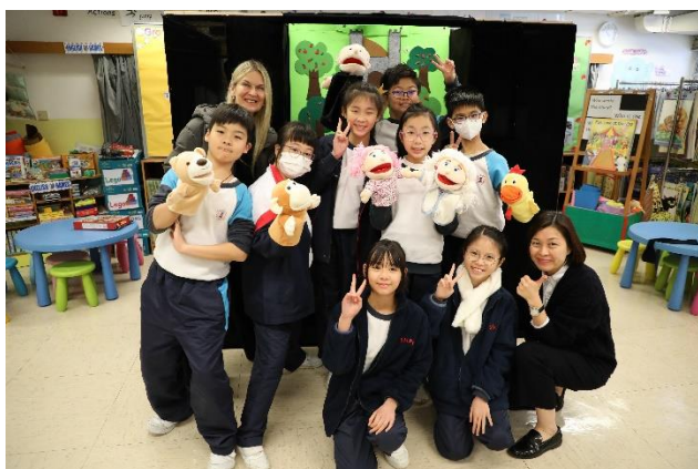
Story to Stage Puppetry Competition (2nd Prize)