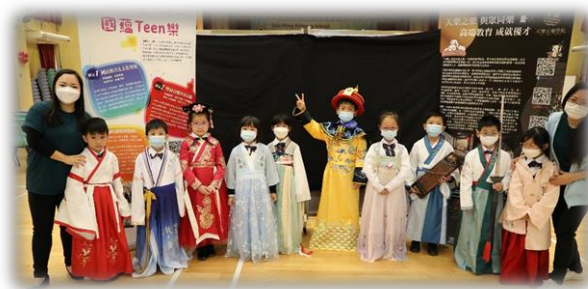
「國蘊 TEEN 樂」學校音樂共享計劃