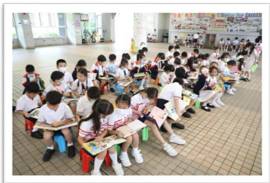
主題閱讀月：同理心

本校課程以學生為本，積極為學生提供多元學習經歷，包括全方位學習、資優培訓、自主閱讀等，讓每個學生透過體驗、探索，打下穩健的學術基礎。