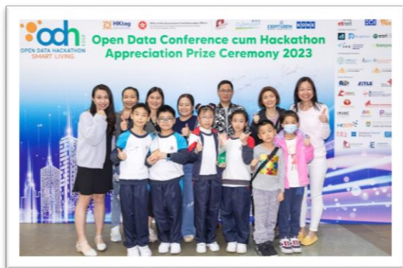
開放數據應用比賽小學組一等獎及最佳團隊獎

為了豐富學生的學習活動，促進學生的身心健康，學校開展達六十多個興趣小組，包含舞龍、唱團、手鐘手鈴、水墨畫、天才小廚神、中國舞、揚琴、二胡、古箏、中樂合奏、中國鼓、綜合藝術、Puppet Theatre、Living English Adventure、簡易田徑、趣味奧數培訓課程、奧林匹克數學培訓課程、羽毛球、乒乓球校隊、花式跳繩進階班、籃球校隊、花式跳繩精英班、古典詩詞書畫班、普通話說故事、中國鼓高班、二胡、琵琶/阮/柳琴、武術、公民兵團、資優解難培訓課程、英語大使資優班、Lego Robot、Coding Buddie、Happy Coding 等，學生積極參與，發揮個人潛能，並透過參與比賽，發揮學生在學術、藝術和體育等方面的優異潛能。