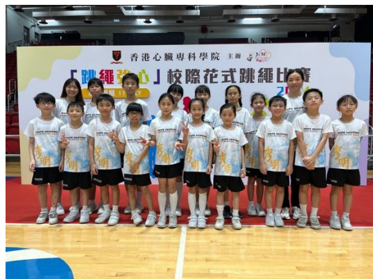
花式跳繩隊隊員於多項比賽中獲獎