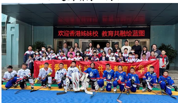
杭州姊妹學校交流