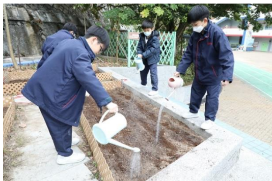
校園小園丁：播種日

透過全面而有系統的「關愛校園」計劃，我們深信能發掘學生潛能，培養學生愛惜自己、關心別人，並把關愛精神延展至社區、祖國以至全世界。學校注重培養學生良好品德，建立正確的價值觀，除推行「環保」教育，提倡愛護環境外，還透過各項「健康校園」計劃，鼓勵學生養成良好的健康生活習慣，追求健康的人生。