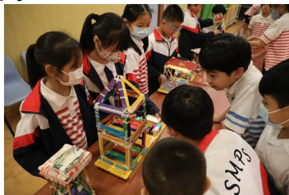
小四跨學科學習：建築工程師