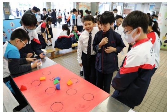
精神健康周-幸福加油站