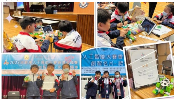
2023 深港澳人工智能大賽金獎